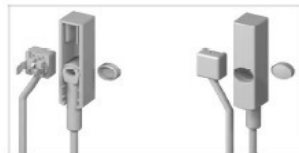
con accessori JXF:HCAIK0100S1